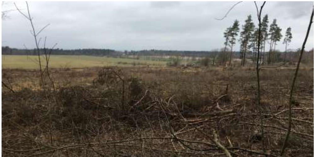
Planområdet med utblick åt nordväst

Planområdet ligger mellan Glömminge och Strandskogen, i ett landskap som består av en mosaik av jordbruksmark och skogsmark. Området utgörs främst av hygge efter avverkad tallskog. Av flygbilder att döma planterades merparten av tallskogen någon gång på 1940- eller 1950-talet. Öster om hygget, mot väg 136, finns ett mindre område med skogsmark som utnyttjas som friluftsområde av närboende och skolverksamheten. Norr om planområdet, mot Glömminge, är bebyggelsen tätare, medan bebyggelsen i söder är glesare och omgiven av tallskog.