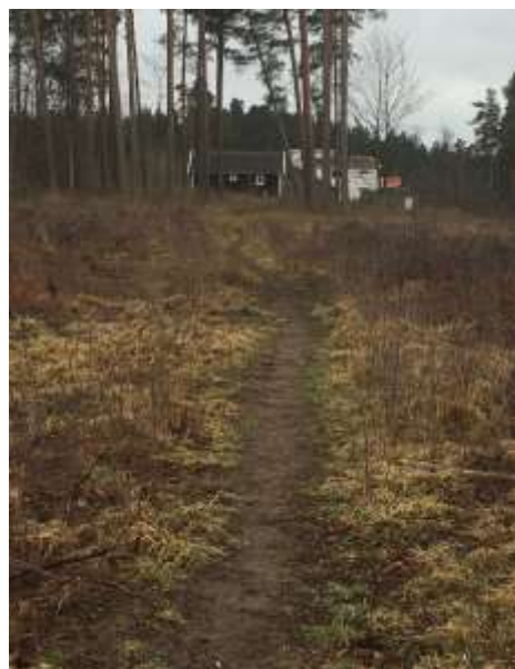
Foto: Besökssten i sydöstra planområdet samt gångstig genom området i nordsydlig riktning.