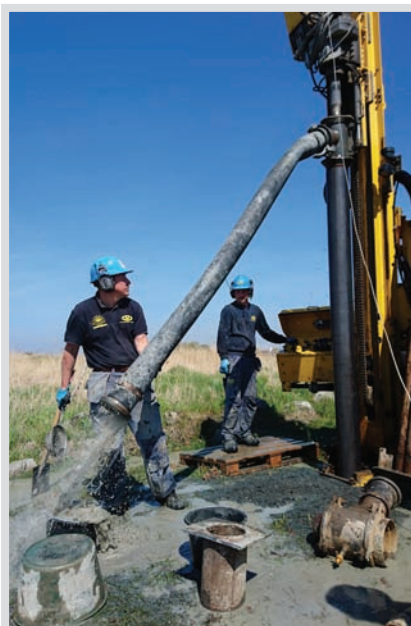
Prov-pumpning av bräckt vatten pågår

Mörbylånga kommuns målsättning är att ett fullskaligt vattenverk med den utprovade tekniken ska stå klart före sommaren 2019.