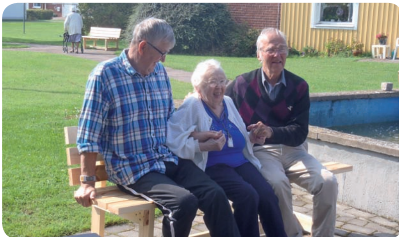
Provsittning av en ljugarbänk på Lindero

På kommunens äldreboenden finns nu ljugarbänkar, där pensionärerna kan sitta och koppla av och umgås. De 20 ljugarbänkarna, och en handikappanpassad 4-hjulig cykel, är en gåva från Familjen Kamprads stiftelse. Stiftelsen vill med gåvan bidra till en förbättrad livskvalitet för äldre.