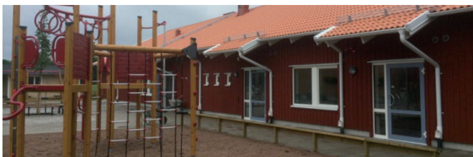
Det nya skolhuset inrymmer lokaler för slöjd, förskoleklass och fritidshem

Stenskolan är en av landets äldsta skolor och har oavkortat varit i bruk som skola sedan 1839. Klassrummen i Stenskolan är idag utrustade med modern teknik men har fått behålla sin gammaldags charm med djupa fönsternischer och högt i tak.