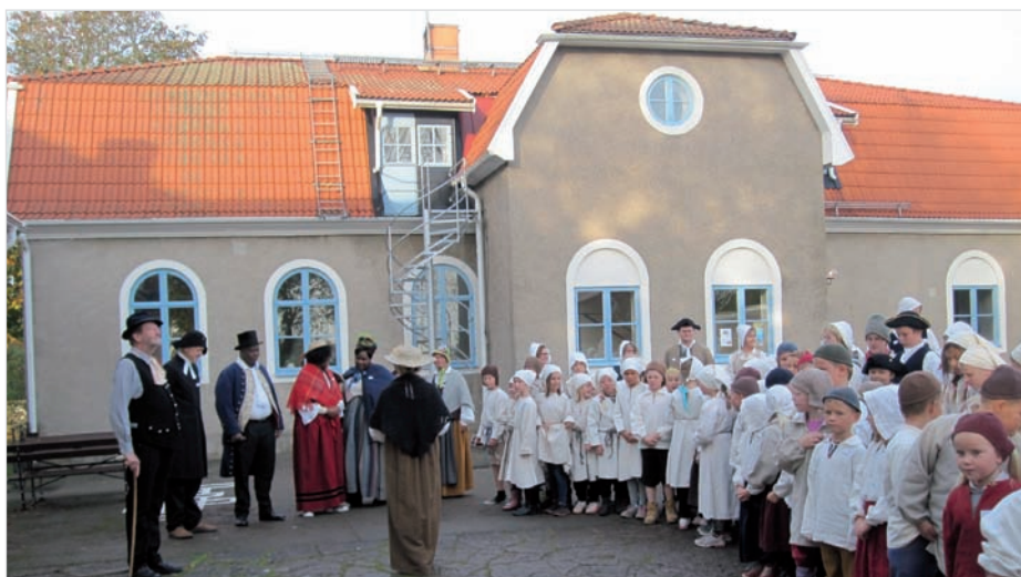
Morgonsamling på skolgården med start av tidsresan tillbaka till 1839