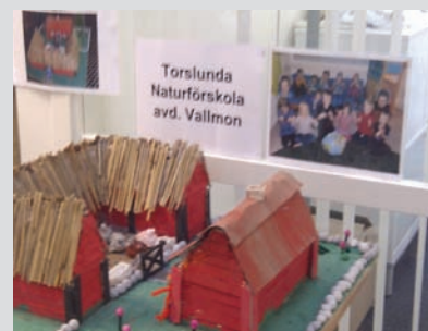
Naturförskolan har byggt en Ölandsgård i miniatyr