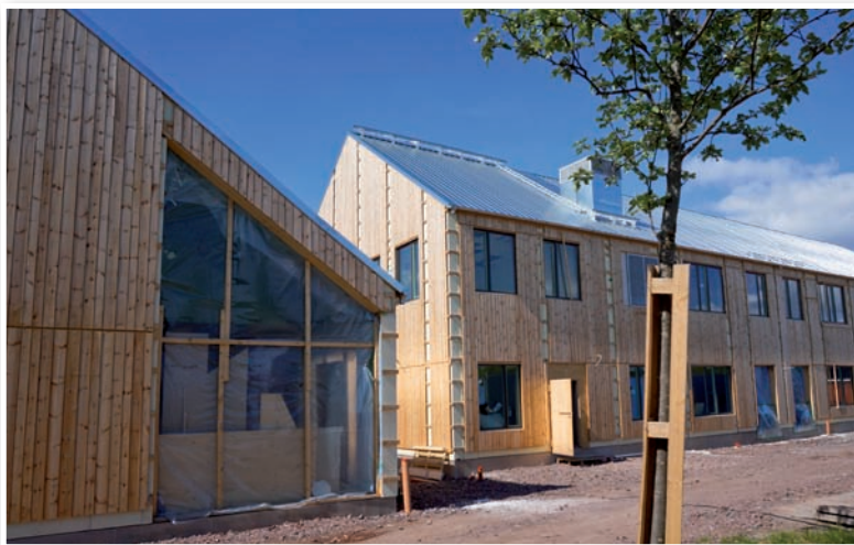
Smaragdskolan börjar ta form.

Smaragden är också en högt värderad ädelsten som bland annat står för tillväxt, harmoni, stabilitet och uthållighet. Smaragdens gröna färg vittnar om ungdom och hälsa. Flera av dessa egenskaper är viktiga på en skola.